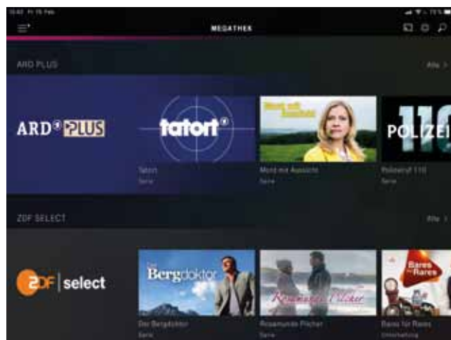
ARD PLUS Channel auf Magenta TV

Was bislang gefehlt hat, war, Zuschauern auch den Zugriff auf ältere Programme der ARD zu ermöglichen. Diesen Zugriff auf die Programmschätze der vergangenen Jahrzehnte möchten wir gerne ermöglichen. Die rundfunkrecht-