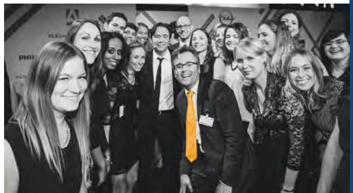
Mit Michael Bully Herbig beim Marken-Award in Düsseldorf

Besuch von Unternehmen in Düsseldorf und Köln auf dem Programm, z.B. die Verlagsgruppe Handelsblatt, Henkel, Innofact Marktforschung, RTL, Globetrotter, GMK Markenberatung, Endmark (Naming) und Comevis (Audio Branding). Auch die idyllisch am Main gelegene Studierendenstadt Würzburg mit über 35.000 Studierenden (knapp 30 % der Bevölkerung) bietet reichlich Abwechslung und Ausflugsmöglichkeiten, z.B. Weinwanderungen, das Africa Festival, das Kiliani Volksfest, das Festungsflimmern sowie eine Vielzahl Bars und Kneipen.