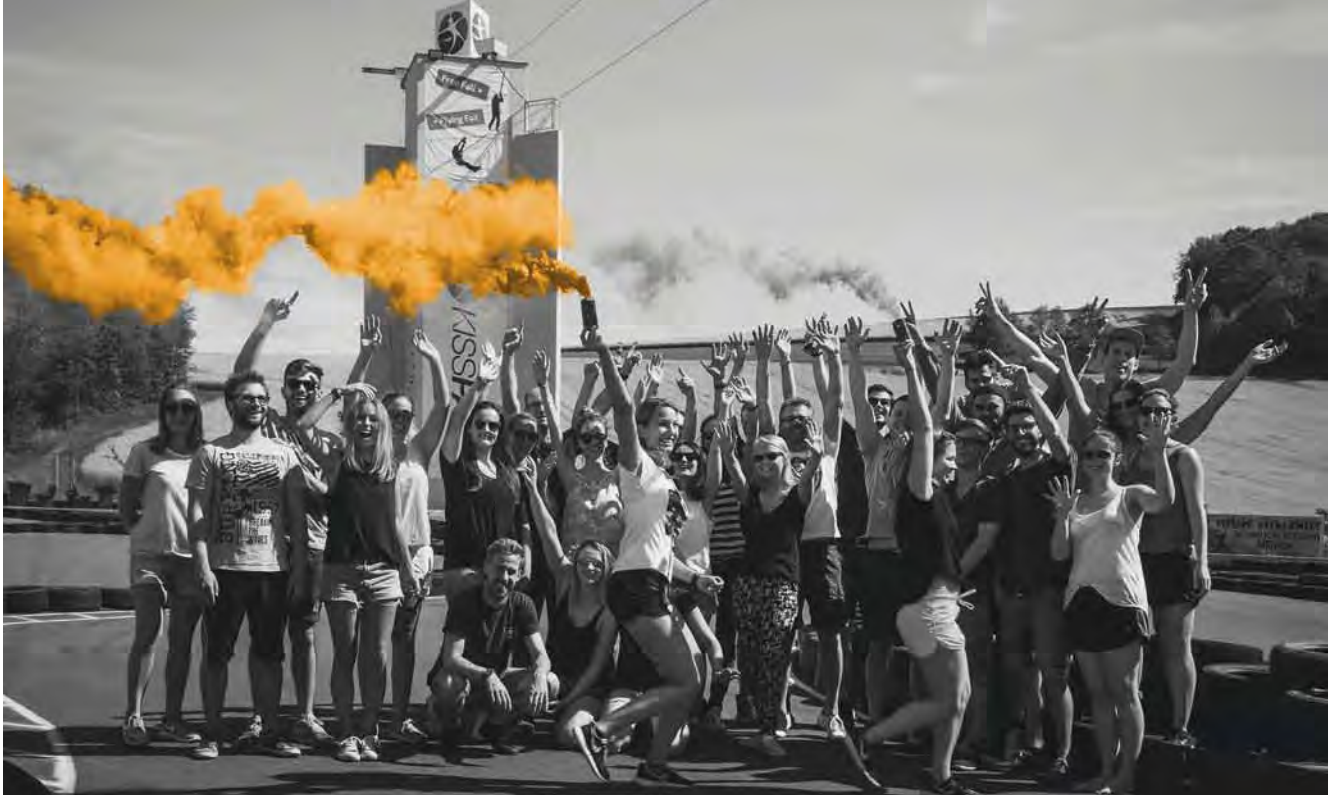
Teamevent im Kisspark in Bad Kissingen