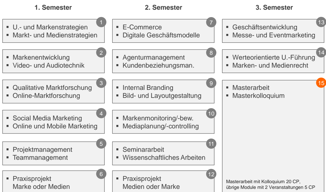
Abb. 3: Module und Studienverlauf

Dabei gilt: Jahrgangsübergreifendes Netzwerken wird in M3ve großgeschrieben. Im Winter organisieren Alumni jedes Jahr eine Skiausfahrt. Für 2019 ist zudem erstmals ein