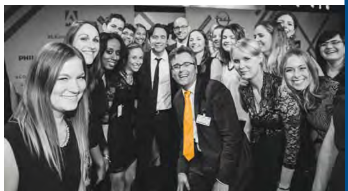
Mit Michael Bully Herbig beim Marken-Award in Düsseldorf

Besuch von Unternehmen in Düsseldorf und Köln auf dem Programm, z.B. die Verlagsgruppe Handelsblatt, Henkel, Innofact Marktforschung, RTL, Globetrotter, GMK Markenberatung, Endmark (Naming) und Comevis (Audio Branding). Auch die idyllisch am Main gelegene Studierendenstadt Würzburg mit über 35.000 Studierenden (knapp 30 % der Bevölkerung) bietet reichlich Abwechslung und Ausflugsmöglichkeiten, z.B. Weinwanderungen, das Africa Festival, das Kiliani Volksfest, das Festungsflimmern sowie eine Vielzahl Bars und Kneipen.