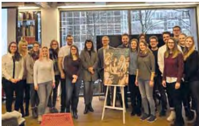
Abbildung 1: Exkursion zu Hubert Burda Media